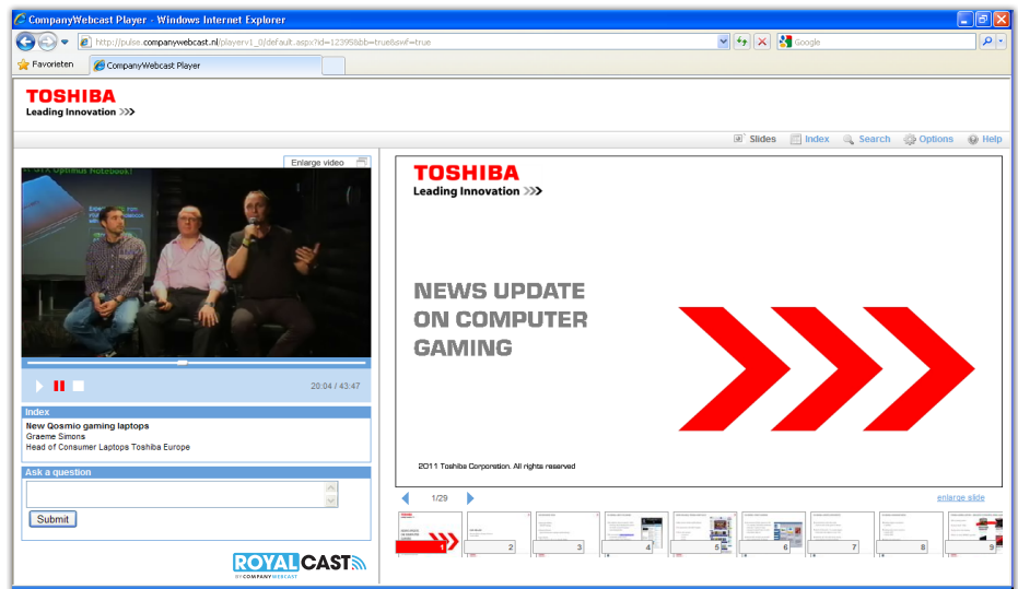
Toshiba gebruikt Webcasting voor haar wereldwijde productlanceringen.