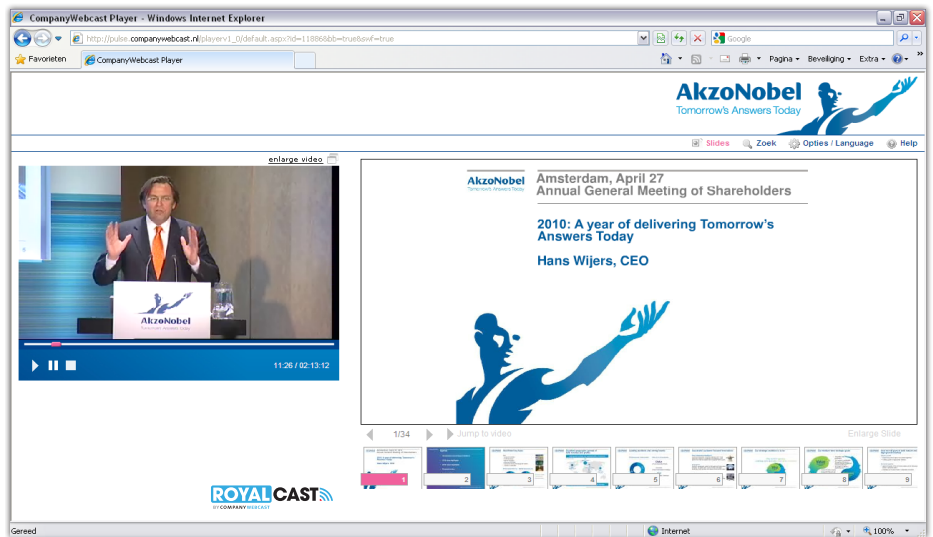
De toespraak van de CEO van AkzoNobel tijdens de AVA blijft On Demand beschikbaar.