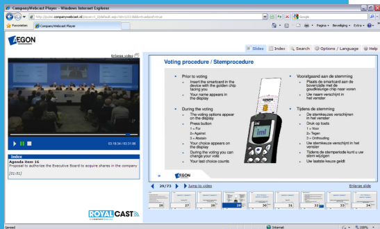
AEGON laat aandeelhouders interactief deelnemen.