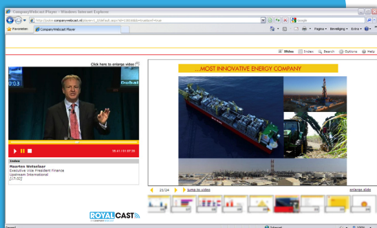
Shell informeert haar wereldwijde management team.

INFORMEER UW MEDEWERKERS VIA DIT EFFICIËNTE EN EFFECTIEVE KANAAL