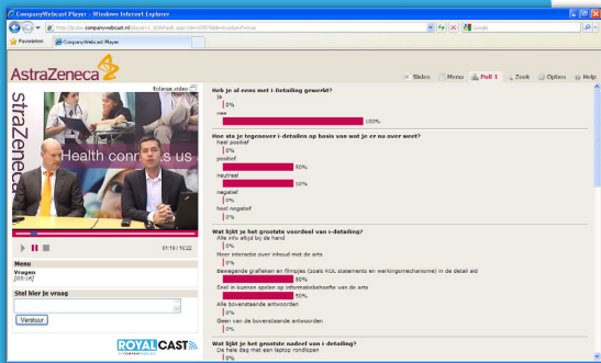
AstraZeneca peilt de meningen via een Webcast.

Met een Webcast van Company Webcast heeft u een kostenefficiënt, krachtig en interactief middel in handen om de aandacht van de huisarts en medisch specialist te krijgen, vast te houden én het bereik onder uw doelgroep te vergroten. U kunt een Webcast zeer doelgroep gericht inzetten, waarbij de huisarts en/of medisch specialist zelf kan bepalen wanneer hij of zij de Webcast bekijkt.