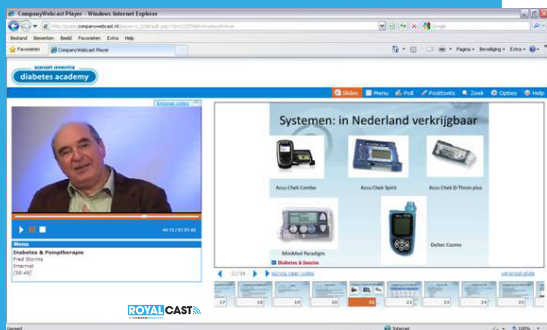
Sanofi Aventis verzorgt seminars via Webcasting.