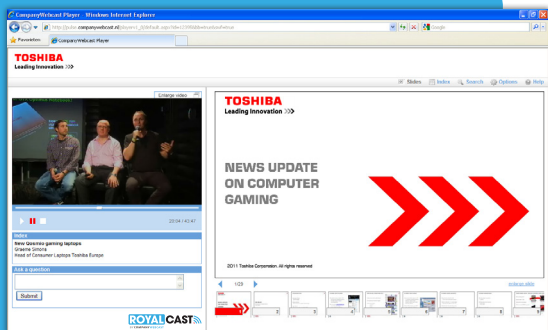
Toshiba informeert de pers over productlanceringen.

WEBCASTING IS DÉ IDEALE AANVULLING OP UW EVENEMENTEN EN CONGRESSEN