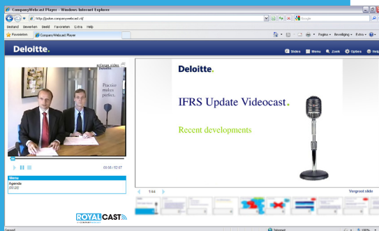
Deloitte voorziet haar accountants van updates.